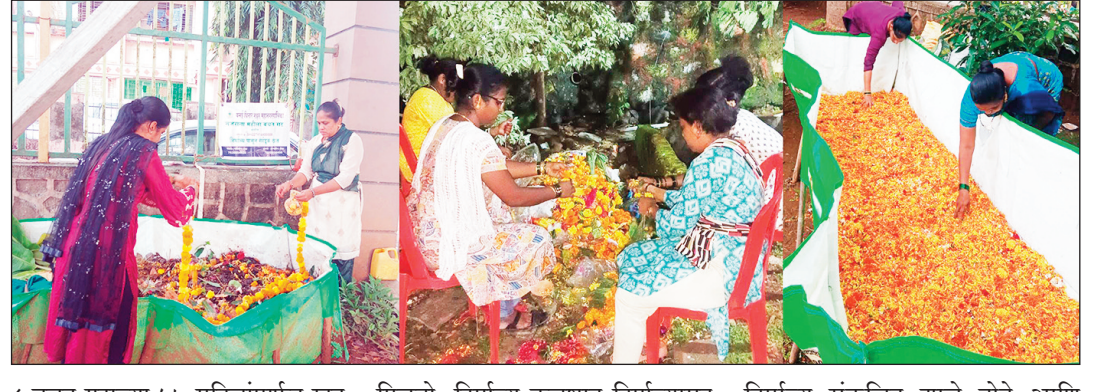
८ बचत गटाच्या

पर्यावरणपूरक ठरत आहे. पर्यावरणपूरक पद्धतीने गणेशोत्सव साजरा करण्याचे वसई विरार शहर महानगरपालिकेचे हे तिसरे वर्ष आहे. या उपक्रमाचा एक भाग म्हणून विसर्जनादरम्यान जमा होणारे निर्माल्य संकलित करून त्यापासून महिला बचत गटांमार्फत खतनिर्मिती करण्यात येते. शहर महानगरपालिकेने विसर्जनाकरिता १०५ कृत्रिम तलाव उभारले असून, त्या ठिकाणी निर्माल्य संकलित करण्यासाठी निर्माल्य कलश ठेवण्यात आले आहेत. यासह नैसर्गिक तलाव, खाडी, समुद्र आदी जेथे विसर्जन होते तेथेही निर्माल्य कलश ठेवण्यात आलेले आहेत. यंदाच्या गणेशोत्सवात दीड दिवसीय, पाच दिवसीय, गौरी-गणपती आणि सात दिवसीय विसर्जनादरम्यान साधारण २१ हजार किलो निर्माल्य संकलित झाले आहे. या निर्माल्यापासून शहरात विविध ठिकाणी